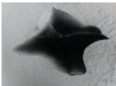
© Salvador Dalí, Fundació Gala-Salvador Dalí, VEGAP, Figueres, 2019