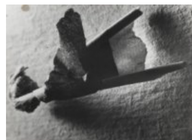
© Salvador Dalí, Fundació Gala-Salvador Dalí, VEGAP, Figueres, 2019 Brassai © Estate Brassai-RMN-Grand Palais