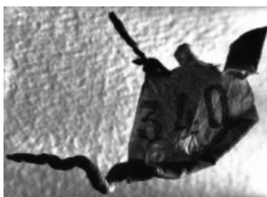
© Salvador Dalí, Fundació Gala-Salvador Dalí, VEGAP, Figueres, 2019