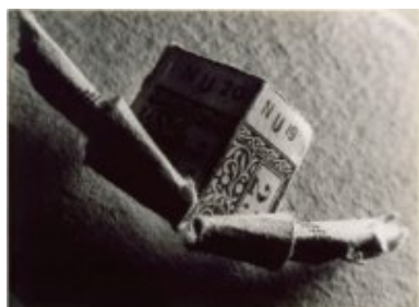
© Salvador Dalí, Fundació Gala-Salvador Dalí, VEGAP, Figueres, 2019 Brassai © Estate Brassai-RMN-Grand Palais