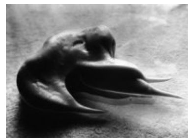
© Salvador Dalí, Fundació Gala-Salvador Dalí, VEGAP, Figueres, 2019 © Estate Brassai Succession - Philippe Ribeyrolles