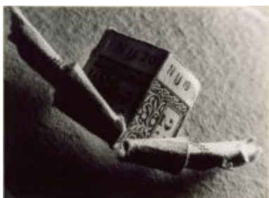
© Salvador Dalí, Fundació Gala-Salvador Dalí, VEGAP, Figueres, 2019 Brassai © Estate Brassai-RMN-Grand Palais