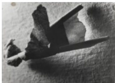
© Salvador Dalí, Fundació Gala-Salvador Dalí, VEGAP, Figueres, 2019 Brassai © Estate Brassai-RMN-Grand Palais