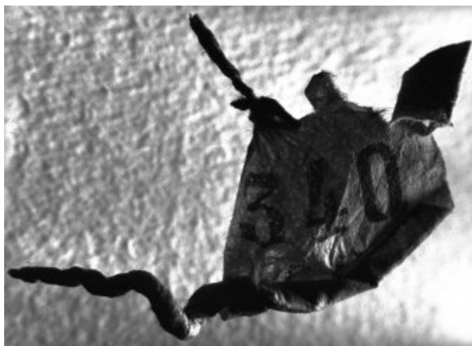
© Salvador Dalí, Fundació Gala-Salvador Dalí, VEGAP, Figueres, 2019 © Estate Brassai Succession - Philippe Ribeyrolles