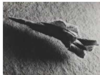
© Salvador Dalí, Fundació Gala-Salvador Dalí, VEGAP, Figueres, 2019 Brassà