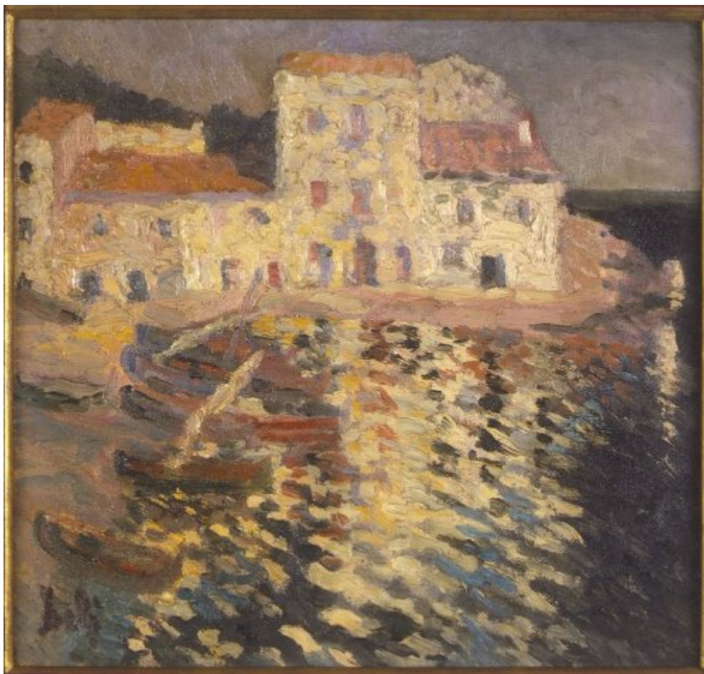
© Salvador Dalí, Fundació Gala-Salvador Dalí, Figueres, 2004