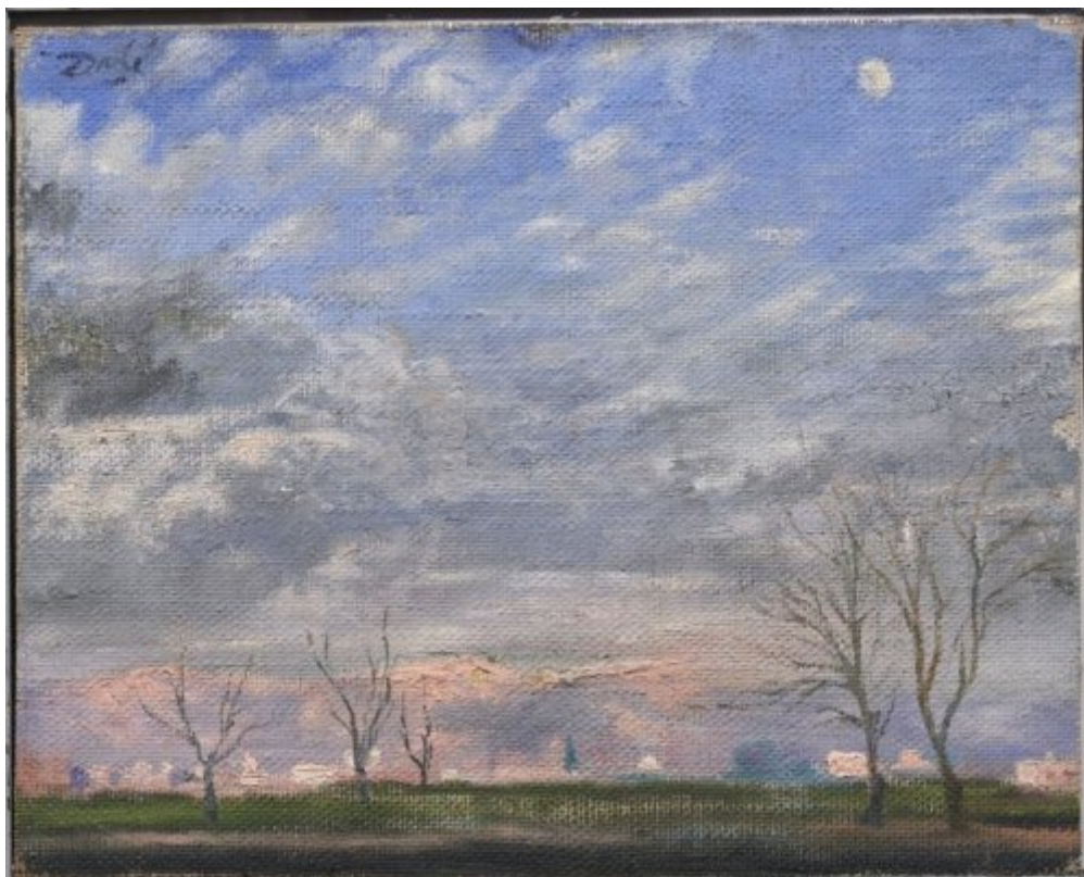
© Salvador Dalí, Fundació Gala-Salvador Dalí, Figueres, 2007