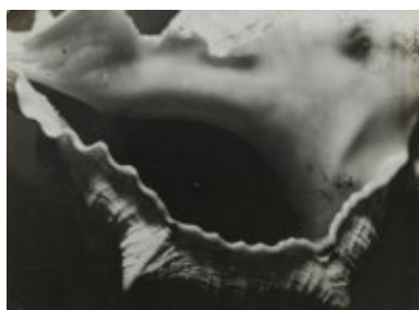
© Salvador Dalí, Fundació Gala-Salvador Dalí, VEGAP, Figueres, 2019 Brassai © Estate Brassai-RMN-Grand Palais