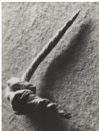
© Salvador Dalí, Fundació Gala-Salvador Dalí, VEGAP, Figueres, 2019 Brassai © Estate Brassai-RMN-Grand Palais