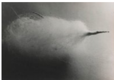
© Salvador Dalí, Fundació Gala-Salvador Dalí, VEGAP, Figueres, 2019