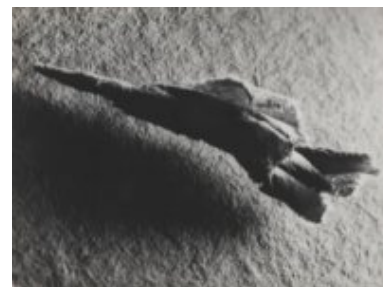
© Salvador Dalí, Fundació Gala-Salvador Dalí, VEGAP, Figueres, 2019 Brassai © Estate Brassai-RMN-Grand Palais