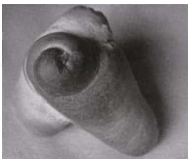
© Salvador Dalí, Fundació Gala-Salvador Dalí, VEGAP, Figueres, 2019 © Estate Brassai Succession